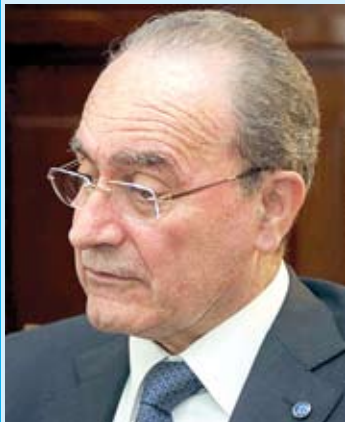
Syd-kusten har intervjuat Málagas borgmästare Francisco de la Torre (PP).

Tre sidor om provinshuvudstaden med bland annat en exklusiv intervju med borgmästaren Francisco de la Torre. Sid. 11-13