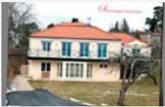
Han köpte topp-vd.n.s. Djursholmsvillan